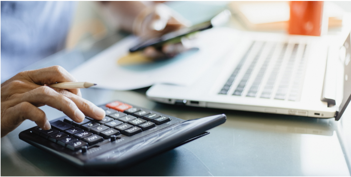
Abbildung 1: Fette Saläre gibt es anderswo: Die Löhne in der Reisebranche liegen meist tiefer als in vergleichbaren Branchen.

Das jährlich erscheinende Lohnbuch gibt einen umfassenden Überblick zu den branchenüblichen Löhnen in der Schweiz. Auch die Saläre der Reisebranche sind aufgeführt – und zeigen: Wer bloss aufs Geld schaut, hält besser Ausschau nach einem anderen Job.